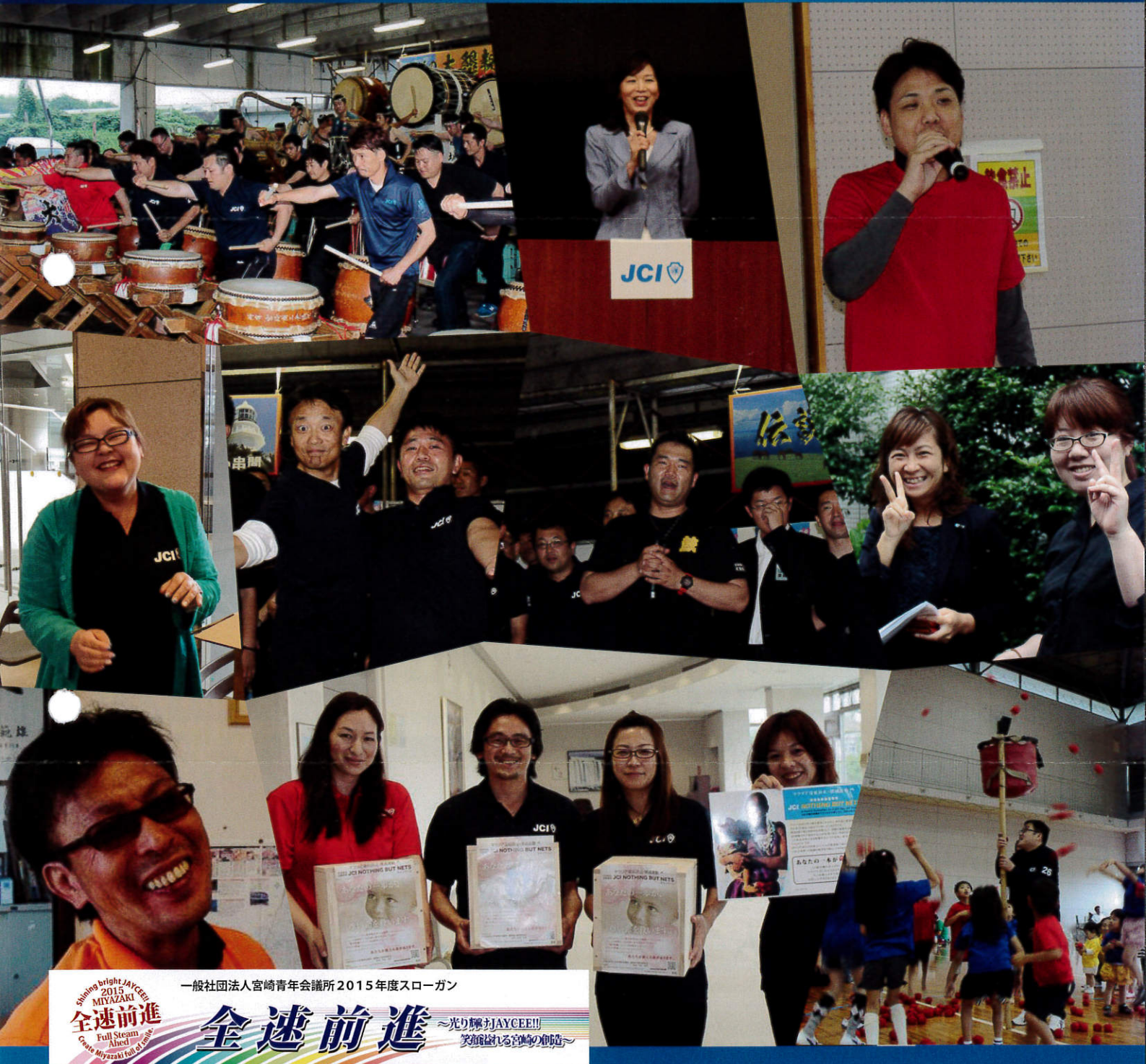
一般社団法人宮崎青年会議所 2015 年度スローガン

Shining bright JAYCEE!! 2015 MIYAZAKI 全速前進 Full Steam Ahead Create Miyazaki full of love