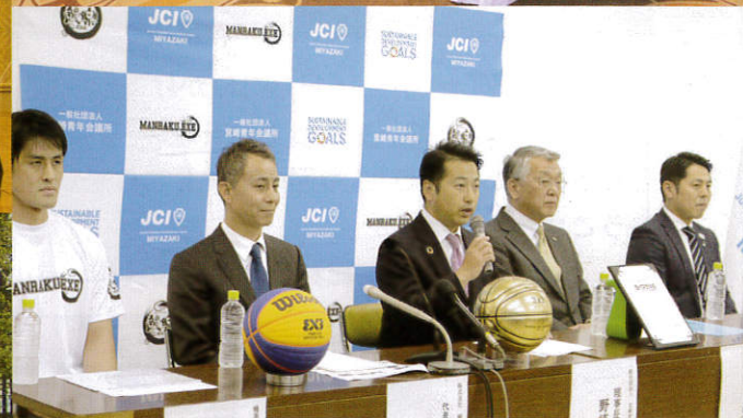
一般社団法人 宮崎青年会議所 2019年度 4月例会