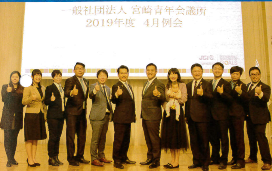
一般社団法人 宮崎青年会議所 2019年度 4月例会