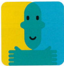
みんなのNIPPON 共生社会プロジェクト

日本国政府（文部科学省）と公益社団法人日本青年会議所が 障害者への総合支援を目的にタイアップしたプロジェクトです。